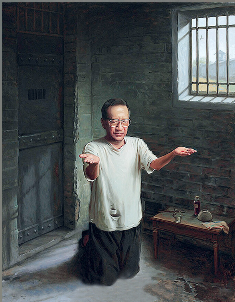
ĐHY Nguyễn Văn Thuận với Linh đạo Hy Vọng